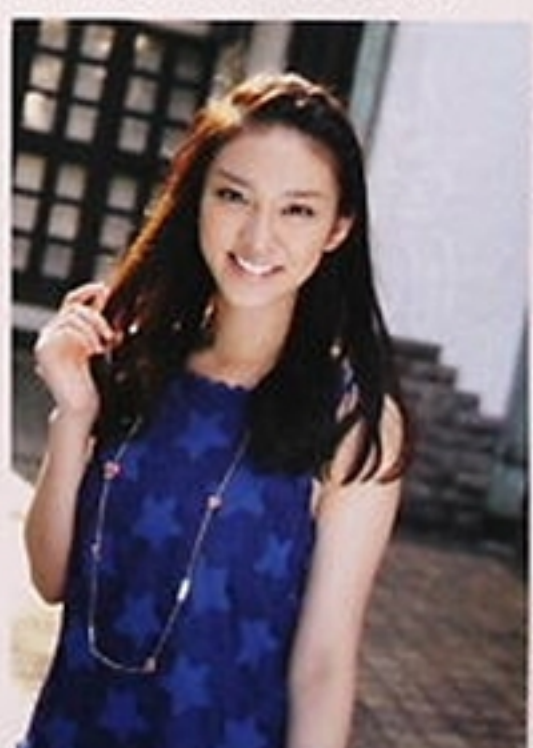
'10年8月「be amie イメージキャラクター」 5千人を超えるモデル・タレントのなかから所属事務所SNS「be amie」イメージキャラクターに