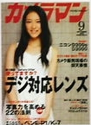
「カメラマン」09年9月号 (モーターマガジン社) カメラ専門誌では白いワンピースで、「咲クン」表紙の雑誌は古本市でも人気