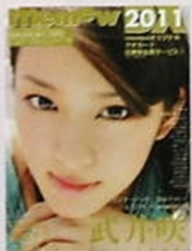
「memew DX 2011」 (近代映画社) アイドル雑誌では表紙+巻頭10ページの大特集を組んで魅力解剖