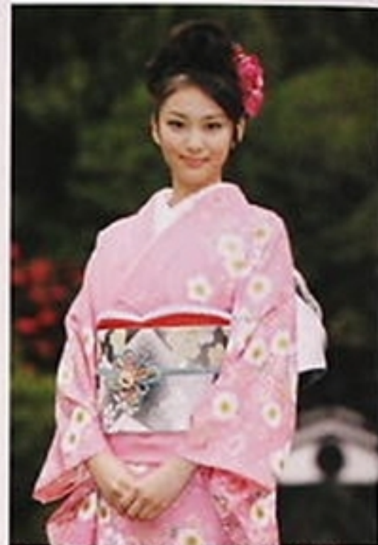
'08年12月「オスカー晴れ着撮影会」 所属事務所の九州行事。この年参加したなかでは最年少だった彼女は「好きな色」というピンクの晴れ着で

多忙を極めたしたけ秋の撮影、忙しさを見せず、スタッフとニコニコ笑いながら話す姿が印象的だった