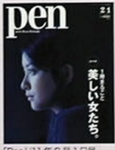
「Pen」11年2月1日号 (阪急コミュニケーションズ) 「美しい女たち」特集で表紙。独特な藍色の世界観が新しい