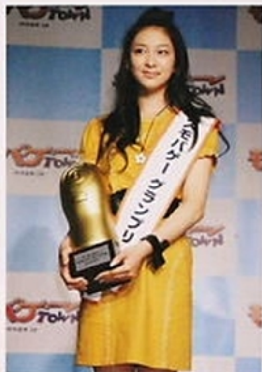
'09年4月「ミスモバゲーグランプリ '09」 当時15歳。「今はモデルをしています。将来は女優として頑張りたい」。このころから「女優宣言」を