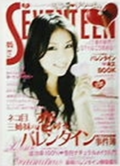
「セブンティーン」08年2月15日号 (集英社) 07年より専属モデルを務める、「お部屋紹介」などドキドキする企画も