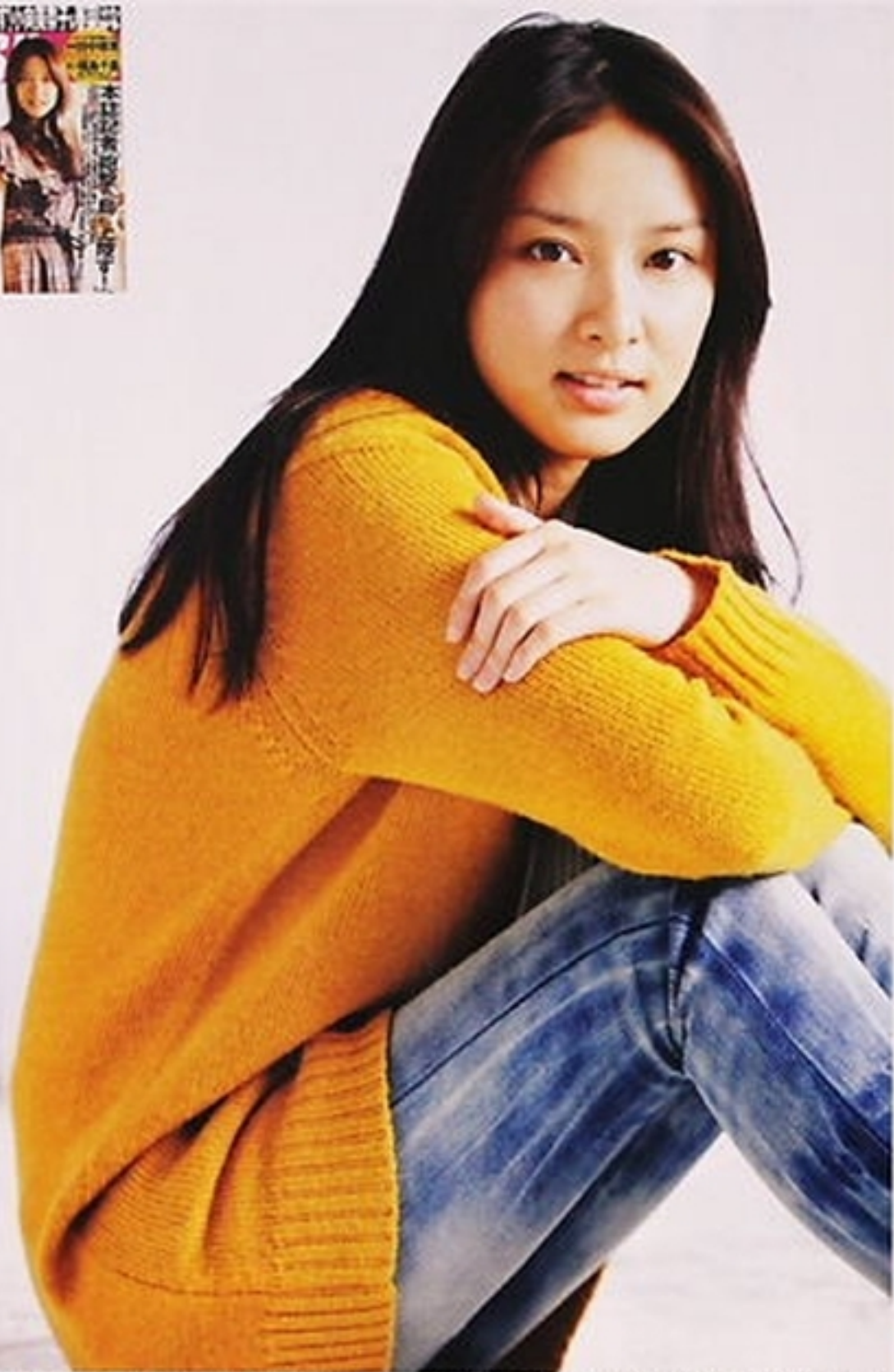
本誌にも出ていただきました！ '10年11月「本誌特写グラビア」

多忙を極めたしたけ秋の撮影、忙しさを見せず、スタッフとニコニコ笑いながら話す姿が印象的だった