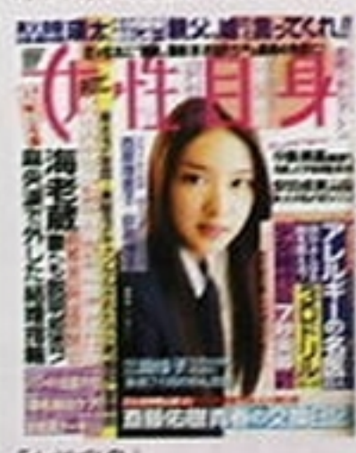
「女性自身」11年3月8日号 (光文社) 創刊50周年を誇る女性週刊誌では撮影の合間にドラマの衣装でパチリ