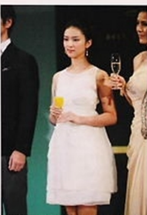
'10年11月「ベストドレッサー賞」 '95年の安室奈美恵（当時19）を抜いての最年少受賞。乾杯がオレンジジュースなのは「若さ」の証です！